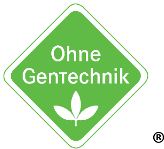
Abbildung A 2: "Ohne GenTechnik"-Siegel für Lebensmittel