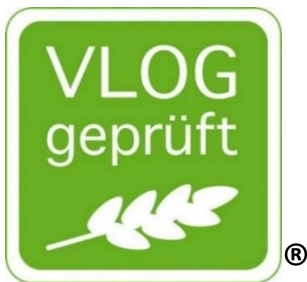
Abbildung A 3: "VLOG geprüft"-Siegel für Futtermittel

Um bei VLOG-zertifizierten Futtermitteln sowie deren Warenbegleitpapieren explizit auf die Abwesenheit einer Kennzeichnungspflicht nach VO (EG) Nr. 1829/2003 und 1830/2003 und damit auf die Tauglichkeit für eine „Ohne Gentechnik“-Lebensmittelproduktion hinzuweisen, ist für VLOG-zertifizierte Futtermittel die verbindliche Kennzeichnung mit der Wortmarke „VLOG geprüft“ oder alternativ mit der Wort-/Bildmarke (Siegel vgl. Abbildung A 3) „VLOG geprüft“ vorgeschrieben (vgl. Kap. B 2.8 bzw. C 3.3). Sowohl die Nutzung der Wortmarke als auch die Nutzung der Wort-/Bildmarke ist im Standardnutzungsvertrag, der mit dem VLOG als Inhaber der Markenrechte geschlossen wird, geregelt. Die Nutzung der Wort-/Bildmarke wird in einem Lizenzvertrag zwischen dem Lizenznehmer und dem VLOG geregelt. Voraussetzung dieses Vertrags ist eine Zertifizierung auf Basis des vorliegenden VLOG-Standards bzw. einem als gleichwertig anerkannten Standard.