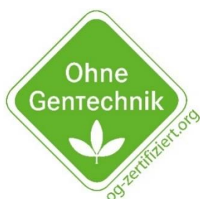
Abbildung A 2: "Ohne GenTechnik"-Siegel für Lebensmittel

Die Nutzung der Wortmarke „VLOG“ für Lebensmittel oder Tiere ist hingegen im Standardnutzungsvertrag geregelt, der mit dem VLOG als Inhaber der Markenrechte geschlossen wird.