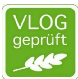
Abbildung A 3: "VLOG geprüft"-Siegel für Futtermittel

Für die Nutzung des „VLOG geprüft“-Siegels muss zusätzlich ein Lizenzvertrag mit dem VLOG geschlossen werden. Voraussetzung dieses Lizenzvertrags ist eine Zertifizierung auf Basis des vorliegenden VLOG-Standards bzw. einem als gleichwertig anerkannten Standard.